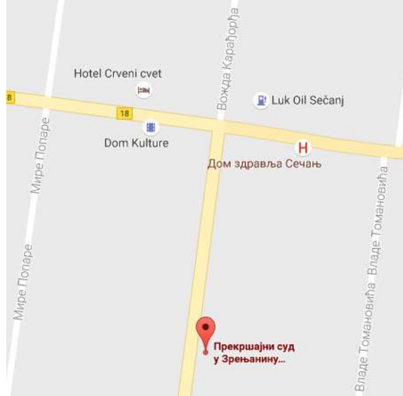
Мапа локације Одељења у Сечњу