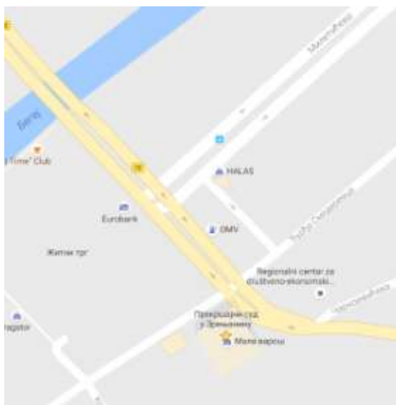
Мапа локације седишта Прекршајног суда у Зрењанину