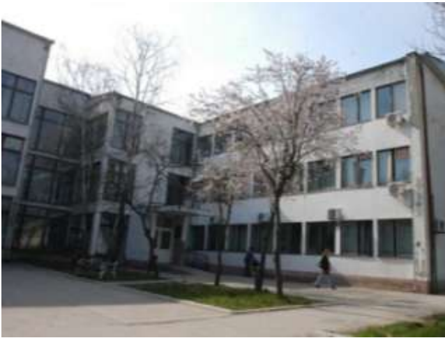
Зграда Одељење у Житишту