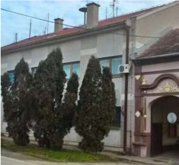
Zgrada Odeljenje u Sečnju