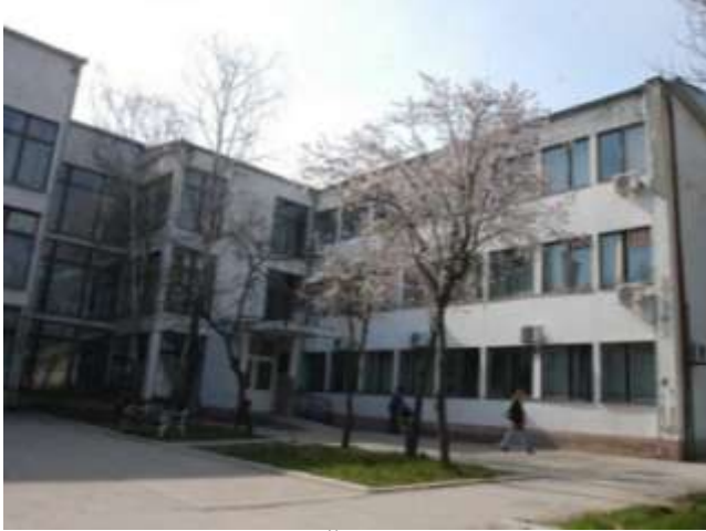
Zgrada Odeljenje u Žitištu