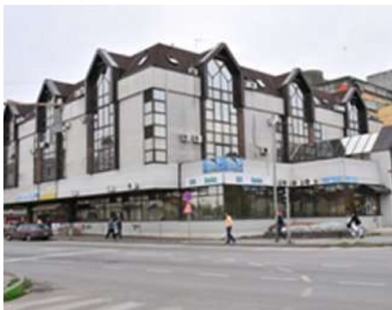
Zgrada sedišta Prekršajnog suda u Zrenjaninu