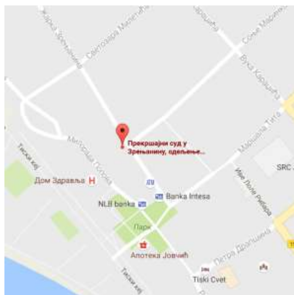
Mapa lokacije Odeljenja u Novom Bečeju