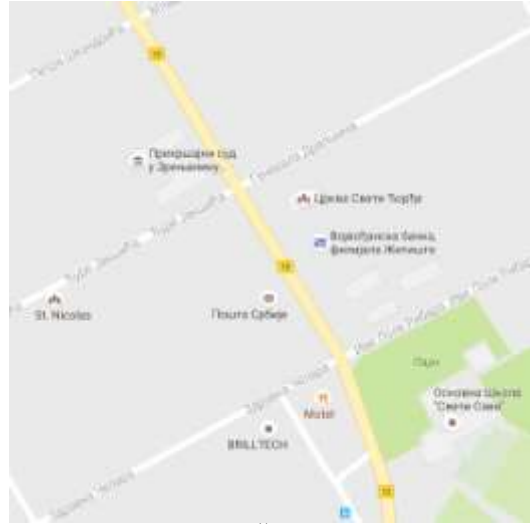
Mapa lokacije Odeljenja u Žitištu