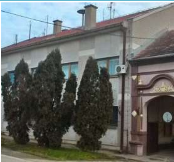
Zgrada Odeljenje u Sečnju