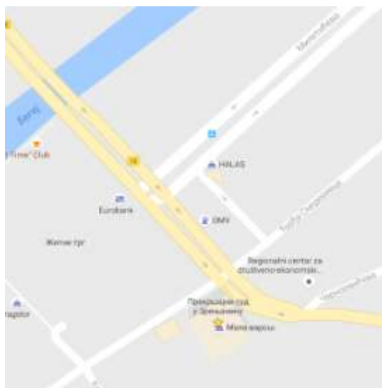
Zgrada sedišta Prekršajnog suda u Zrenjaninu Mapa lokacije sedišta Prekršajnog suda u Zrenjaninu