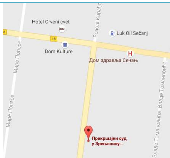
Mapa lokacije Odeljenja u Sečnju