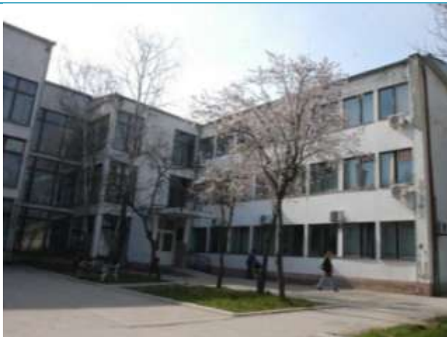
Zgrada Odeljenje u Žitištu