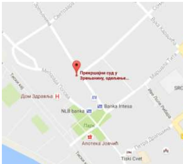
Mapa lokacije Odeljenja u Novom Bečeju