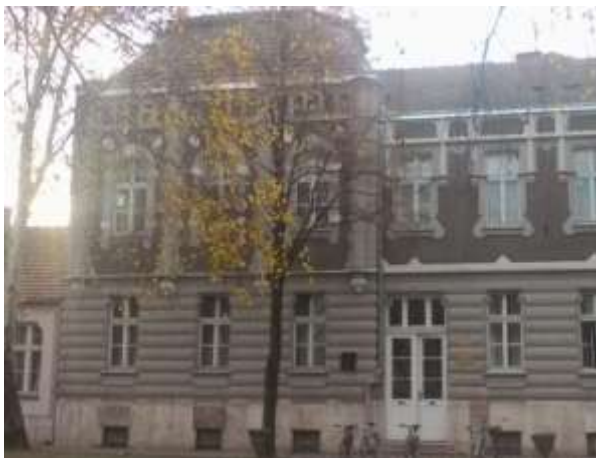
Zgrada Odeljenje u Novom Bečeju