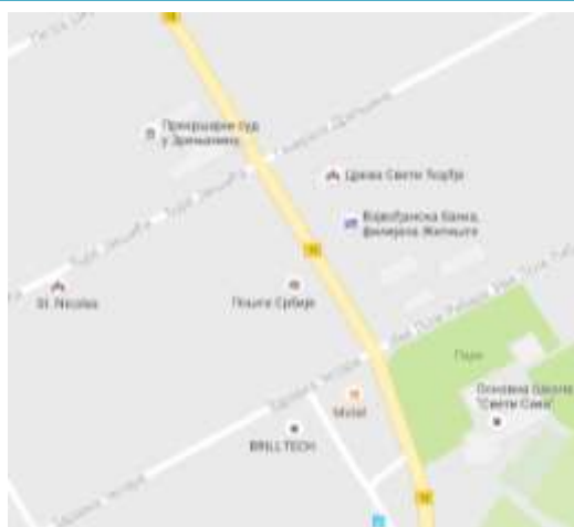
Mapa lokacije Odeljenja u Žitištu